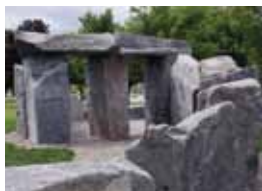
Bill Vazan, Vortext II, 2009

1, chemin du Musée, arrondissement de Lachine H8S 4L9 ☎ Angrignon, autobus 110 ou 120 Ouest ☎ 514 634-3478 http://lachine.ville.montreal.qc.ca/musee